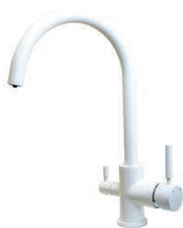
Matná bílá FC50W