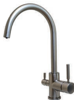
Broušený nerez FC50-BN