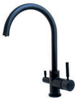
Matná černá BC50-C