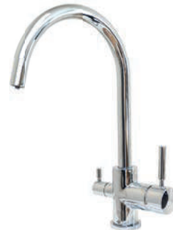
Lesklý chrom FC50